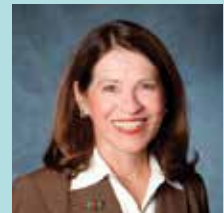
SALLY OSBERG Skoll Foundation