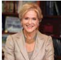
JUDITH RODIN Rockefeller Foundation