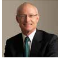
PROFESSOR MICHAEL E. PORTER, PRESIDENTE Profesor Bishop William Lawrence University, Harvard Business School