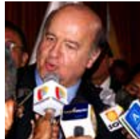
HERNANDO DE SOTO Institute for Liberty and Democracy